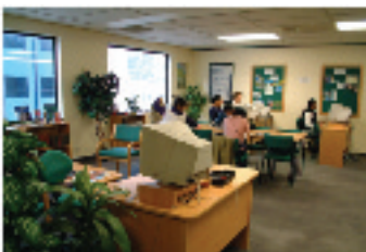
▲ 図書室、自習室では学生が自由に勉強できる