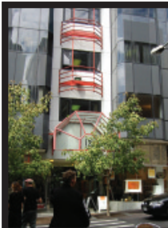
▲ クイーンストリートから1ブロック