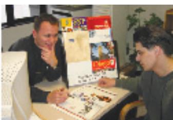
▲ これからの進路相談中

この学校は生徒様いろいろな国籍のスタッフがおり、非常に楽しく仕事ができます。毎日沢山の学生と話しをしますので、生徒一人ひとりの特徴もすべて覚えていますよ。