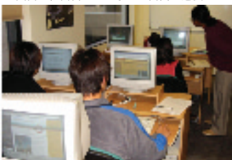
▲ 自慢のコンピューターラボ

会話クラスはどの学校にもない独自のシステム 2時間の会話クラスは疲れる というのが生徒からの素直な感想。それくらい会話をする量が多いので口が疲れるという意味だ。ダイナスピークの2時間のメインストリームコースは、先生から質問されたら直ぐに答えるということとを繰り返す。質問、答えるという風にリズムに乗って進んでいく。先生は机に座らずに立つて授業を進行していく。先生と生徒の会話の応酬は他の学校の会話コースの比ではない。最初は分らなくても良いのです。そのうちきつと分かるようになりますからと校長は言う。会話を覚えるというよりは、もっと基本的なところの、コミュニケーション能力を育てるためのシステムだ。ちなみにこのメインスト フリー用フリーダムプラン 12週間フルタイムで申し込むと授業料の割引と特典が受けられるフリーダムプランがある。6週間後に休みをとって帰国間近に残りの6週間を受講できるなどワーホリにとっては嬉しいプランだ。またコース中に祭日が重なれば、その分を延長してくれるところも非常に良心的だ。 中堅英語学校では充実の施設 ダイナスピークは現在150名ほどの学生が勉強している中堅クラスの英語学校だ。小さいながらもきちんとした図書室兼自習室もあり、好きな時間に利用できる。また最新のコンピュータラボは特別な学習プログラムが入っており、授業で使われている。最近新しいコースとしてマイクロソフト認定のイーコースも開始した。 リムクラスは最高でも6人までの限定クラスだ。 ダイナスピークは現在150名ほどの学生が勉強している中堅クラスの英語学校だ。小さいながらもきちんとした図書室兼自習室もあり、好きな時間に利用できる。また最新のコンピュータラボは特別な学習プログラムが入っており、授業で使われている。最近新しいコースとしてマイクロソフト認定のイーコースも開始した。