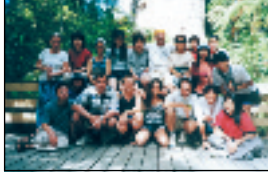
▲アクティビティトリップ

雰囲気、施設、サポートが絶妙のバランス 明るく元気な学校 ワールドワイド・イングリッシュスクールの特徴を一言で言えば、明るく、元気な学校、という形容詞がぴったりの英語学校だ。全体的な雰囲気、先生やスタッフの生徒に対する姿勢、勉強する環境等、すべてが元氣いっぱい。 各英語コースは学生ができるだけ楽しく勉強ができるように工夫されている。午後の授業は通常の会話クラスに加え、ビジネス英語や試験対策ライティング、発音、ムービークラスなども定期的に行われている。 AAAコースはアクティビティコース、午前英語・午後アクティビティコースでNZ初心者には最適なコース。 コンボコースは全国4校の提携校との共同コースで、転校が簡単にできる特別プログラムだ。長期の申し込みには移動費用も無料となる。いろいろな都市で勉強してみたい行動派にはぴったり。その他にもNZスタディーコースやダイビングコースなどもある。 学校の施設も非常に整っており、15台の 充実のカウンセラー陣 ワールドワイドはアジアからの学生はもちろん、ドイツやブラジルなどをはじめ、現在20を超える国籍の学生が勉強している。国籍バランスは非常にとれているので、1つの国籍が多くなることはない。またカウンセラーも各国籍に対応できるように、ほとんどの言葉をカバーしているというから驚きだ。数カ国語を話すカウンセラーも少なくなく、学生が安心して勉強できるためのサービスの一つだ。 コンピューターは無料でインターネットが利用でき、日本語にも対応している。英語のビデオ教材やテープも無料で利用できる。大きなロビーにもあり授業で利用することもできる。 また学校保有のアパートメント(ニューマーケット)があり、長期の学生は利用可能。ホームステイはちょっと苦手という学生には人気がある。一人部屋、シェアールームなどが選べるが、非常に人気があるのでできるだけ早めの申し込みが必要(週末のドールから)。