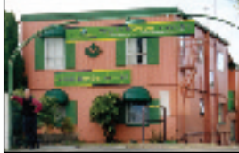
▲ワールドワイドアパートメント