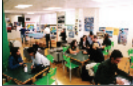
▲学生ラウンジルーム