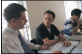
▲授業は真剣そのもの